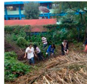
trabajo en la composta