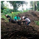
Trabajo colectivo de estudiantes en sede Cuernavaca