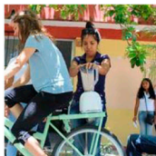
Ahorrando con la biclicuadora