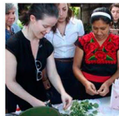
aprendiendo de la comunidad